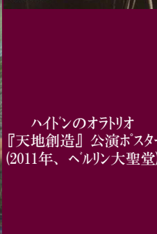
ハイドンのオラトリオ『天地創造』公演ポスター(2011年、ベルリン大聖堂)

【2024秋～2025春の注目公演】 ● ミラノ・スカラ座 ：昨年12/7・シーズン開幕後の後半は、ドイツものが気になる『 ばらの騎士 』(K.スタヤノヴァ[マルシャリン]、指揮K.ペトレンコ、10/M-10/E)、『 ラインの黄金 』(指揮C.ティールマン、10/E-11/B)。プッチーニ没後100年記念特別演奏会(11/29、J.カウフマン/A.ネトレプコ/R.シャイ-指揮スカラ座管)も。 次シーズン開幕演目 はヴェルディ『 運命の力 』(A.ネトレプコ/J.カウフマンらが登場、12/10が初日) ● ウィーン国立歌劇場 ：来シーズン前半のモンテヴェルディ『 ウリッセの帰郷 』(11/E)、H.プフィッツナー『 ハレストリーナ 』上演が新鮮。年明けは『 カヴァレリア・ルスティカーナ 』『 パリアッチ 』のセット公演(E.ガランチャ/J.カウフマン、1/M)、『 ナクソ島のアリアドネ 』(A.ネトレプコ、1/E)、 オペラ座舞踏会 は2/27。 ● ベルリン国立歌劇場 ：A.ネトレプコ出演『 ナブッコ 』(10/B-M)は完売、年明けの『 エレクトラ 』(I.テオリン/E.ヘルツィウス、1/E-2/M)は来シーズンの目玉! 並行して『 ばらの騎士 』(D.ダムラウ(1/E-2/B)も大注目! ● ハ・イェル国立歌劇場 ：コルンゴルト『 死の街 』(K.F.フォークト、10/B)、『 アイーダ 』(E.ガランチャ、12/M) ● ハリ・オペラ座ガルゴ宮 ：T.クルンツィス指揮のラモー『 カストルとポリュクス 』《PREMIERE》(10公演1/E-2/M) ● ハリ歌劇場 ：『 シモン・ボッカネグラ 』(M.レベッカ/L.テツィア/M.ペルトウージ、10/M)は注 ● ウィーン・フィル ：K.マケラ指揮でマーラー「第6」(12/M)、R.ムーティ指揮の NewYearコンサート 、 ウィーン・フィル舞踏会 (1/23) ● ベルリン・フィル ：A.ネルソンス指揮ブルックナー「第8」(12/M)、K.ペトレンコ指揮 シルベスター・コンサート はR.シュトラウス・ブ람スがテーマ(12/29-31) ● ハ・イェル放送 ：S.ラル指揮で、「 マイ受難曲 」(9/E)、「 トリスタン 」第二幕(11/B)、マーラー「第7」(11/B)、ブルックナー「第9」・ワグナー/ウェーベルンの小品他(11/M)、ブ람ス「 ドイツ・レクイエム 」(2/M) ● ハリ管 ：K.マケラ指揮でフォーレ「 レクイエム 」・R.シュトラウス「 死と変容 」(11/B) ● UTOPIA管 ：T.クルンツィス指揮のもとドイツ各地でマーラー「第5」を演奏(10/E-11/B)