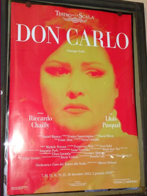
ミラノ・スカラ座の23/24シーズン幕開け(12/7)はヴェルディ歌劇『ドン・カルロ』、4人の大物歌手登場で超人気公演に。(23.12 ミラノ・スカラ座ポスター)