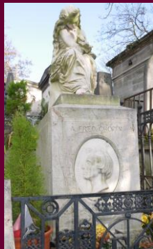
パリ・ヴァンドーム広場のCHAUMET・2Fがショパン最期の家(左)、とショパンの墓(右)、パリ・ペールラシェーズ墓地