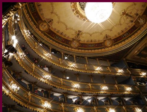
モーツァルト歌劇『ドン・ジョバンニ』が初演されたブラハム・エステート劇場