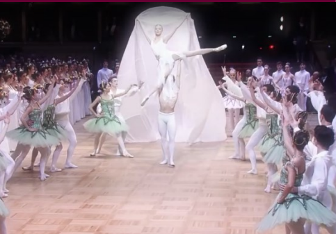
最高の格式で世界的著名人・セレブが集うウィーン・オペラ座舞踏会(毎年2月)