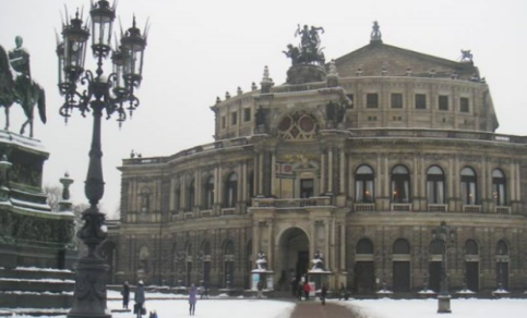
ワグナー『タンホイザー』、『さまよえるオランダ人』が初演されたドレスデン国立歌劇場”ゼンパーオーバ”、真冬の威容