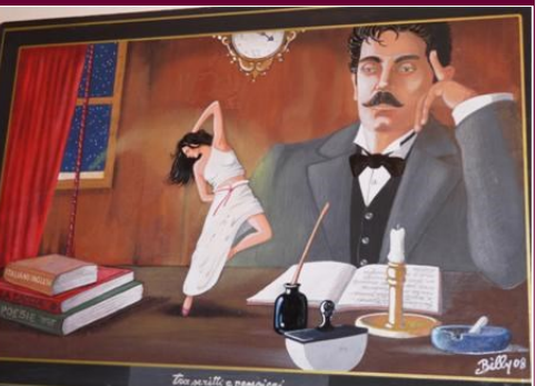
プッチーニ(イメージ) 〈トーレ・デル・ラーゴの宿にて〉