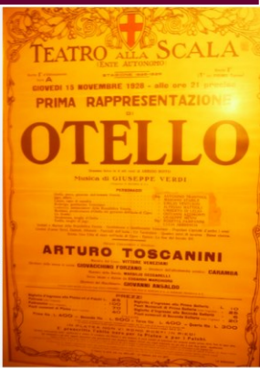
指揮者トスカニーニと『オテロ』上演ポスター