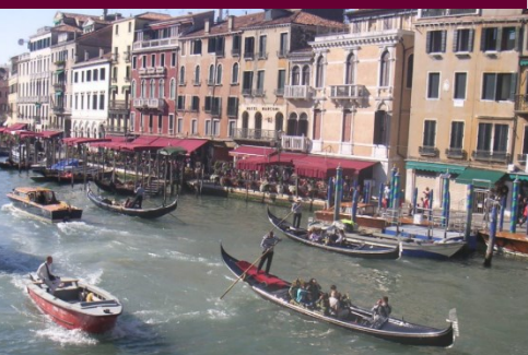
芸術家を魅了するヴェネチア。...ワグナー最期の部屋、ウィヴァルディの生家、モンテヴェルディ、ストラヴィンスキーの他にロシア・バレエ創始者ディアギレフもここに眠る